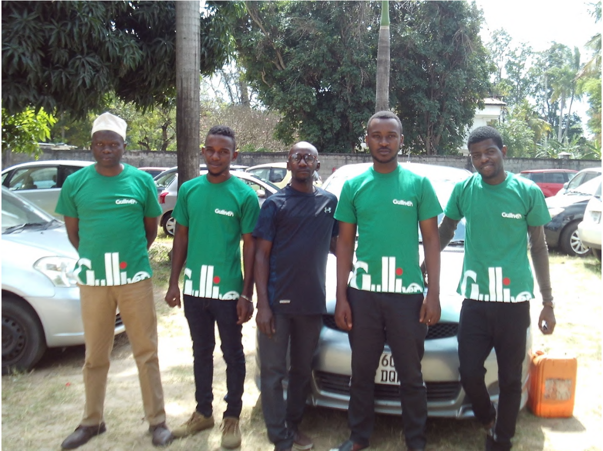
※本サービスを利用し、新たな生活を始めた現地のドライバーの様子